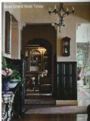
Холл Grand Hotel Timeo

В Таормине – одном из самых известных и живописных курортов острова Сицилия – расположились два отеля гостиничной сети Orient-Express .