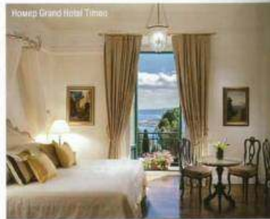
Номер Grand Hotel Timeo

Отель, стоящий на высоте 200 метров над уровнем моря, неподалеку от горы Тауро, начал принимать первых гостей еще в 1873 году. В середине XX века Grand Hotel Timeo облюбовали звезды итальянского кинематографа – здесь нередко останавливались Софи Лорен и Федерико Феллини. Не раз была замечена в Grand Hotel Timeo и Одри Хепберн. Не так давно гостиницу полностью реконструировали: появились новые здания, обновились номера, был построен оздоровительный центр, большинство процедур которого проводятся в саду под открытым небом. Кроме того, теперь гости отеля могут позагорать на частном пляже дружественной гостиницы Villa Sant' Andrea . Между отелями курсирует бесплатный шаттл.