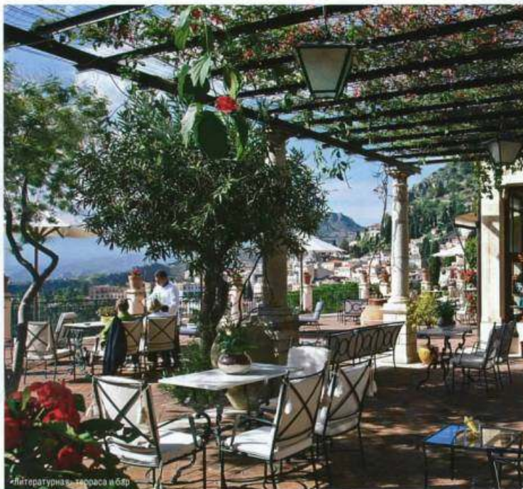
Литературная терраса в бар