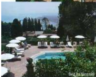
Вид на бассейн

Главный ресторан отеля Il Dito e la Luna расположен на террасе площадью 25 000 квадратных метров с потрясающим видом на море и вулкан Этна. Здесь подают блюда традиционной сицилийской и средиземноморской кухни.