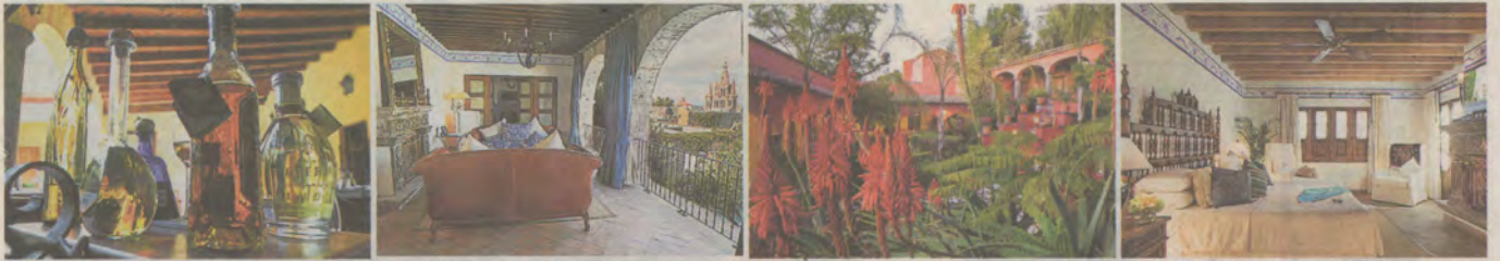
Todo en este hotel parece desafiar al inexorable paso del tiempo: su rústica decoración, sus vistas a la ciudad, sus rincones para el descanso, sus habitaciones señoriales...

SAN MIGUEL DE ALLENDE / MÉXICO / CASA SIERRA NEVADA. Con un conjunto de bellas residencias históricas de estilo colonial, este encantador hotel de Orient-Express brinda la máxima experiencia mexicana