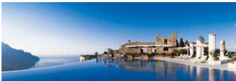
La piscina panoramica. | A panoramic pool.

Wagner: "Il giardino di Klingsor è trovato!"