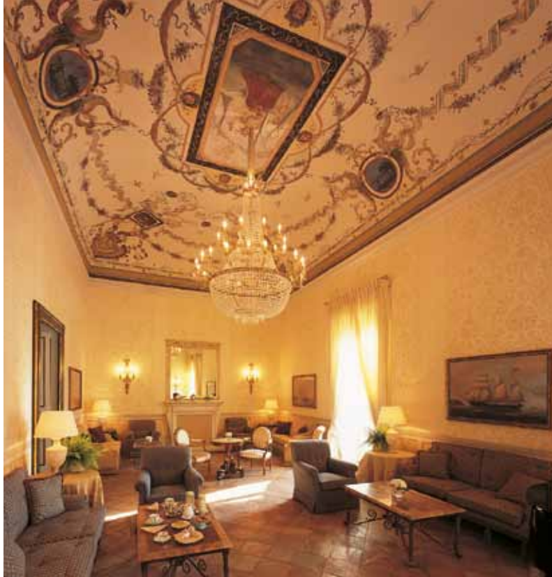
Una sala affrescata. | A frescoed room.

Attorno i luoghi che hanno saputo ispirare a Lawrence L'amante di Lady Chatterley e che hanno fatto esclamare a Wagner: "Il giardino di Klingsor è trovato!" La brezza marina sussurra promesse d'amore agli ospiti che passeggiano nel meraviglioso giardino fiorito dell'albergo, fra le terrazze in pietra viva, il romantico pergolato di glicine bianca e la suggestiva piscina protesa verso l'infinito. Cespugli di rose immacolate, limoni, melograni, il profumo dolce dei fiori d'arancio e di sottofondo la musica del pianoforte proveniente dal piano bar. Tutto parla il linguaggio della passione. Una lingua semplice da imparare, anche per l'ospite straniero, grazie ai corsi di seduzione appositamente organizzati dall'hotel.