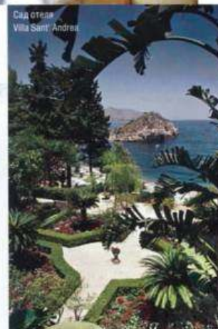
Сад отеля Villa Sant' Andrea

Этна возвышается над уровнем моря на 3350 метров и считается самым крупным действующим вулканом Европы. Экскурсию помогут организовать консьержи отеля.