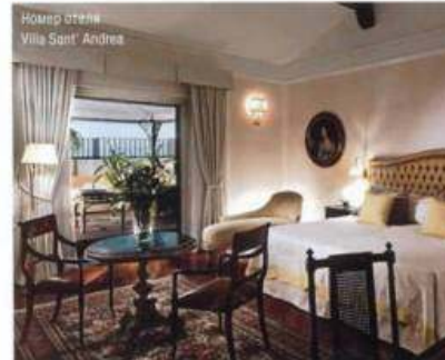
Номер отеля Villa Sant' Andrea