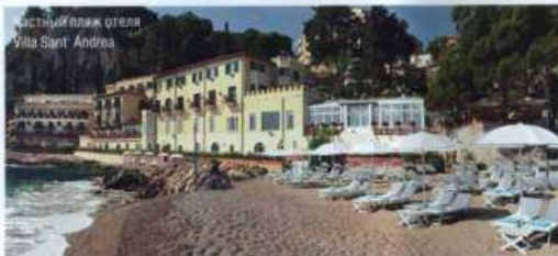
Частный пляж отеля Villa Sant' Andrea

Вилла Сант-Андреа была построена на восточном побережье острова в 1830 году для семьи английского лорда. В 1950 году здание на окраине Таормины отреставрировали и преобразовали в отель, сохранив стиль и атмосферу аристократической резиденции: в номерах по-прежнему можно найти ценнейшие предметы антиквариата и мебель эпохи Людовика XIV. Есть в номерах Villa Sant' Andrea и просторные террасы с видом на море и на живописный сад, в зелени которого утопает территория отеля. В меню ресторана Oliviero акцент сделан на морепродукты – только что выловленную рыбу и морских гадов готовят на ваших глазах. Поужинать также можно в баре Al Fresco, расположенном на пляже.